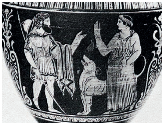
Argos med Matte och Husse

Fröjda sig må den som av ett djur blir hälsad